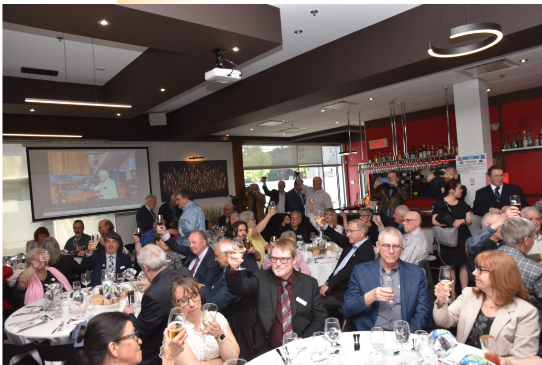
Gala du 100 e anniversaire, le 30 mai