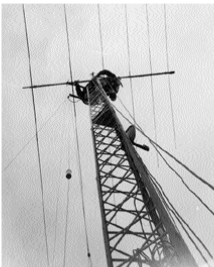
La tour et l'une des antennes directionnelles