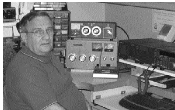
La station de VE2PS

sion toute trouvée pour élire un nouveau conseil d'administration. Devinez à qui échoit la présidence? Vous avez vu juste, c'est à VE2PS que reviennent les honneurs du poste en même temps que les problèmes. Nous sommes en mai 2002. Un jour, un ami lui avait dit qu'il était un altruiste. Anecdote qui en dit long